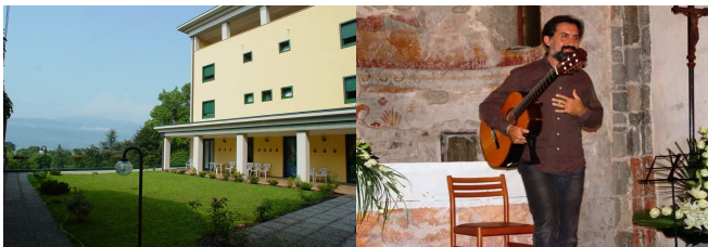
Sede del Corso

Non saranno accettate iscrizioni telefoniche e/o non confermate dalla quota di iscrizione. Saranno infine rilasciati Diplomi di frequenza a tutti gli allievi Effettivi ed Uditori. A tutti gli allievi Effettivi sarà consegnato un omaggio in corde e gadget offerti da Savarez .